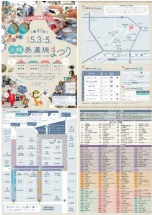
表面 / まつり概要