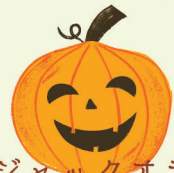
陶器製ジャックオランタン カラフル絵付け体験