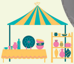
クラフトテント市