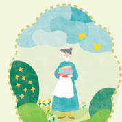
ポタリーさんの 小さな庭